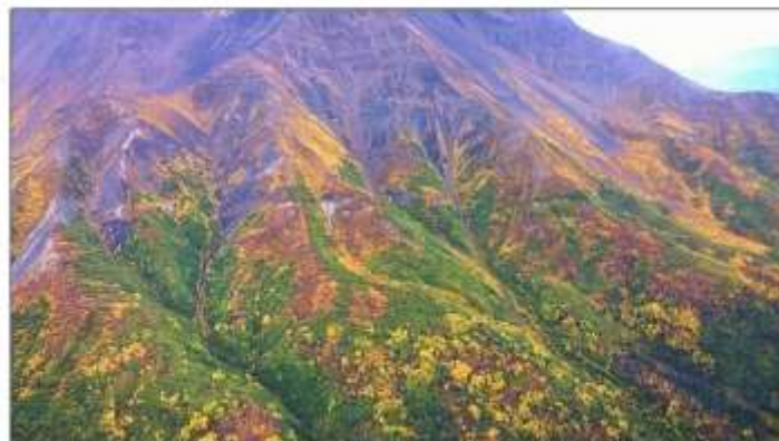
哇噻！這大自然的燦爛地絕絕對勝過任何人工的產品