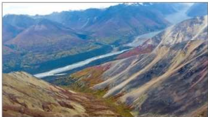
因隔著飛機陳舊的窗子拍照，加上反光，遠景的效果大打折扣