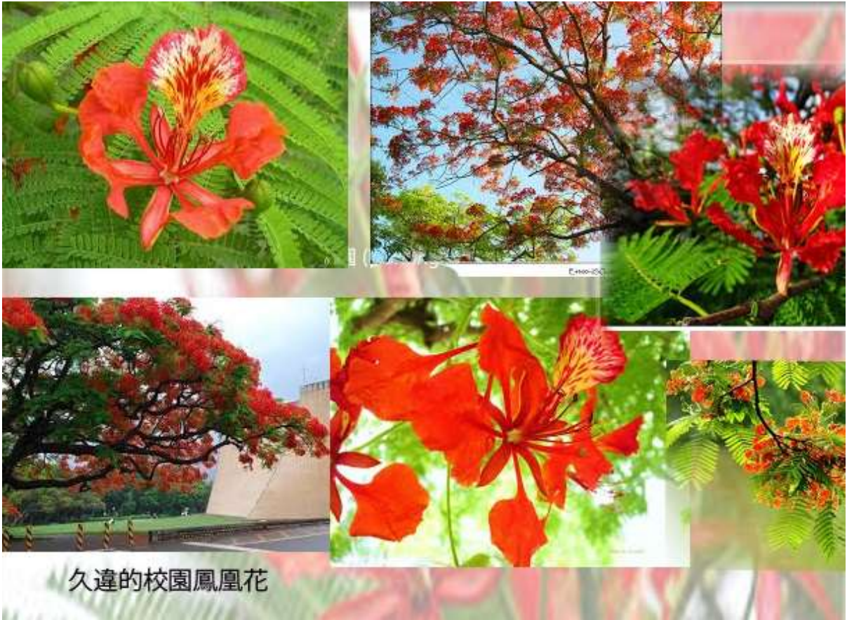
久違的校園鳳凰花