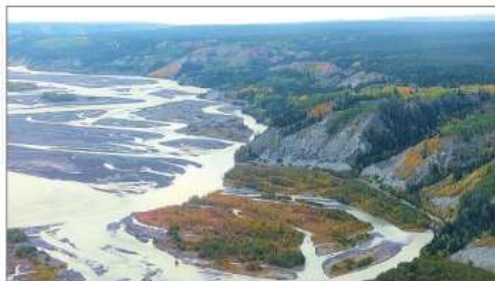
我的第一個驚訝是：誰聽人提過珠兒的秋色竟如此亮麗？